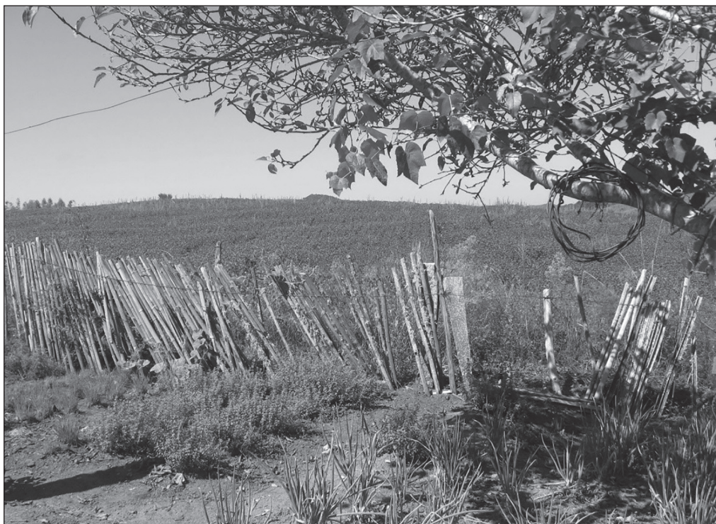
Figura 4. Cultivo de temperos e ervas em quintal de família quilombola. Do outro lado da cerca, área pertencente a uma família italiana, arrendada para a produção de soja

As famílias que não dispõem de espaço para o trabalho agrícola, seja ele próprio ou cedido, conseqüentemente, tem como única fonte de renda os trabalhos não agrícolas ou programas de transferência de renda, destinando seus quintais para o cultivo de temperos e ervas (alecrim, salsa, sálvia, arruda e etc.), que ocupam menos espaço e são cultivados para fins alimentares e medicinais (Figura 4).