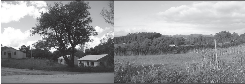
Figura 3. Localização dos espaços de uso comunitário na área do Núcleo I

Arroio do Padre. Na localidade do Núcleo I estão as áreas de uso coletivo: o espaço de uso das crianças, igreja, salão da associação, utilizado para reuniões e confraternizações (figura 3).