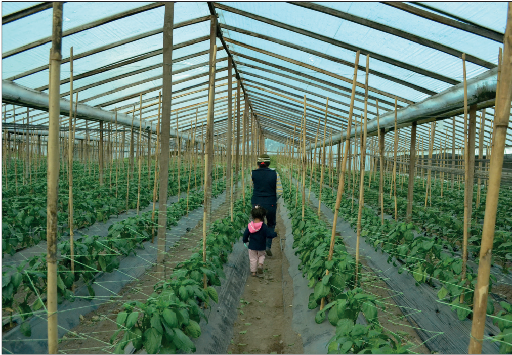
Imagen 2. Producción bajo invernáculo en el CHP