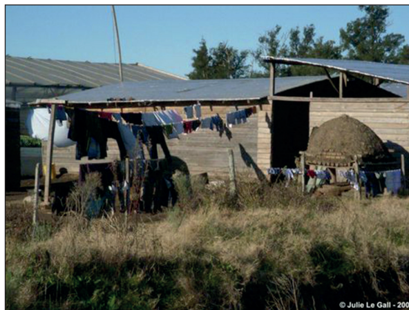
Imagen 1. Vivienda de familia horticultora de origen boliviano en el CHP