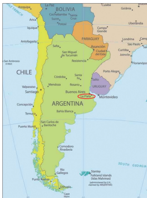
Mapa 1. Ubicación de La Plata

Se recortó y se agregó el círculo rojo para destacar La Plata.