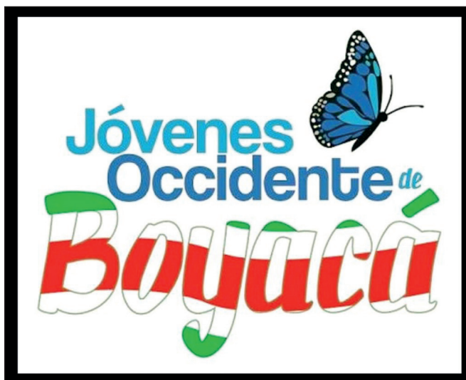
Figura 1. Logo JOB

Además del discurso, JOB se presenta como una organización juvenil de servicio social. Propone un logo que no se vincula a las imágenes reiterativas de la región, la esmeralda o los cerros de Fura y Tena, sino a la imagen de la mariposa azul, 7 especie endógena de la región de Boyacá. En la tipografía del logo predomina el color azul de la mariposa y los colores de la bandera de Boyacá (figura 1).