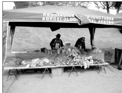
Dos productores del grupo Bajo Invernadero vendiendo hortalizas (Fuente: N. Rebañ).