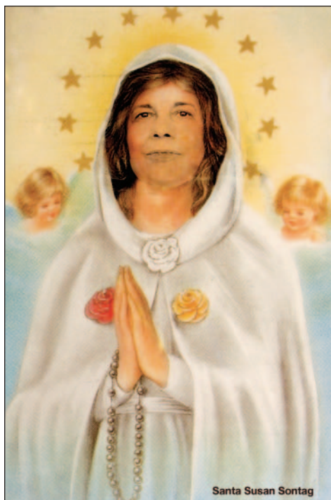
Santa Susan Sontag