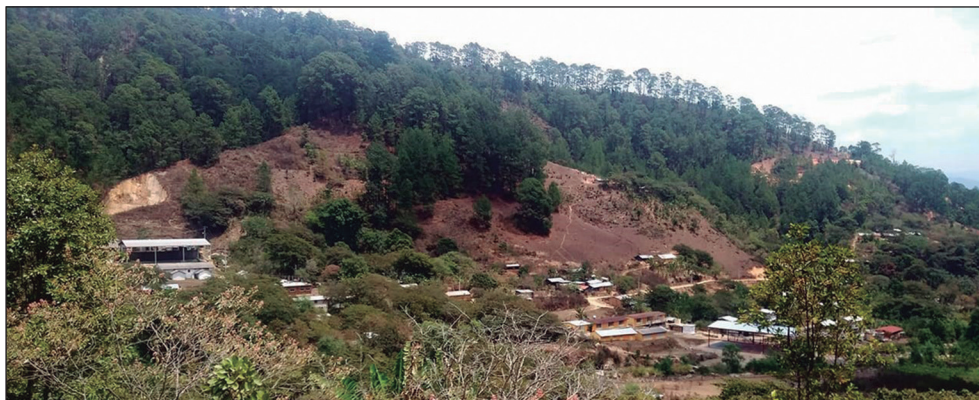
Imagen 1. Vista de Xochiatenco, comunidad me'phaa

Entre las décadas de 1970 y 1980, a unos kilómetros de Xochiatenco, en Barranca Panal, se instaló una minera artesanal con inversión de un grupo de acapulqueños, quienes luego la cedieron a una transnacional canadiense. Campesinos del lugar sustituyeron la actividad agrícola por la mina; los hombres laboraban como obreros y las mujeres abastecían de alimentos. Las consecuencias de la minera fueron la dependencia de sus salarios y enfermedades causadas por químicos altamente tóxicos.