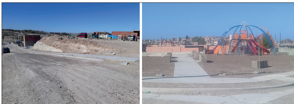
Figura 4. Promeba: Cordones cuneta. Figura 5. Promeba: Parque de juegos

Registro personal, 10 de septiembre de 2019.