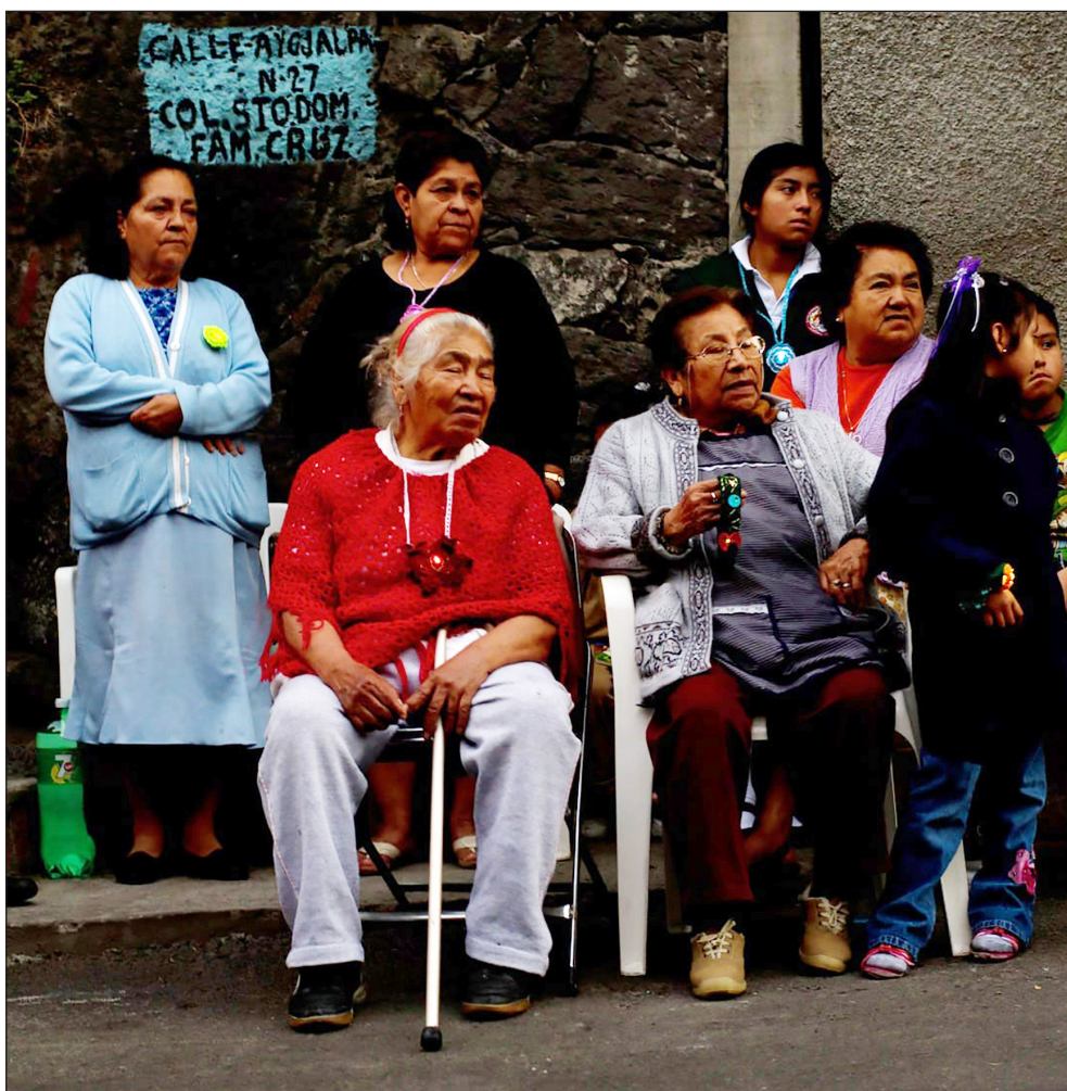
Figura 5. Taller de iluminación artesanal