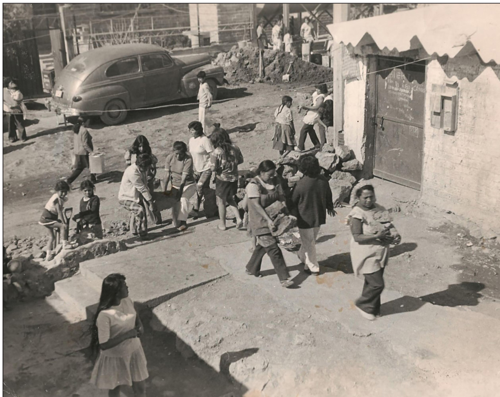
Figura 1. Mujeres colaborando en la construcción del Pedregal de Santo Domingo