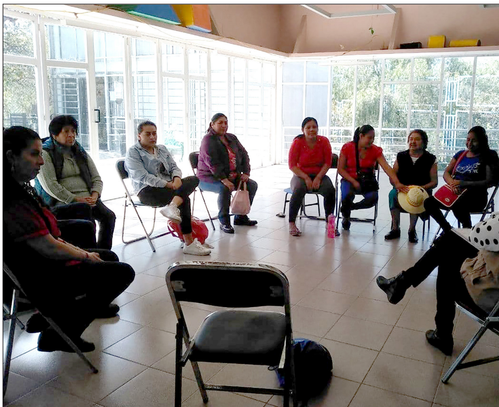
Figura 2. Mujeres en Movimiento reunidas en Casa de las Mujeres “Ifigenia Martínez”