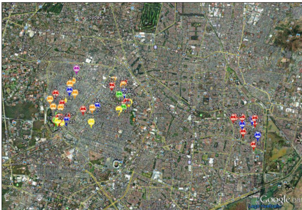
Figura 3. Cartografía colaborativa con 60 puntos en Coyoacán, Ciudad de México

Elaborado por la autora a partir de Google Earth.