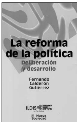
Fernando Calderón La reforma de la política. Deliberación y desarrollo ILDIS, Nueva Sociedad, Bolivia, 2002.

Este nuevo libro de Fernando Calderón aborda como tema central la pérdida de legitimidad de las democracias latinoamericanas y las alternativas que podrían ponerse en práctica para recuperar esa legitimidad. El autor argumenta que las condiciones que legitimaron los procesos de transición y democratización desde la década de los 80 enfrentan actualmente serias limitaciones políticas y estructurales. Calderón analiza las nuevas condiciones en las que se debe repensar la democracia desde cuatro ejes: a) los procesos de globalización, b) la complejización de lo social, con sus fuertes rasgos de inequidad y pobreza, c) el malestar general frente a la política y los mecanismos de representación, y d) el predominio de una cultura autoritaria y de la desigualdad.