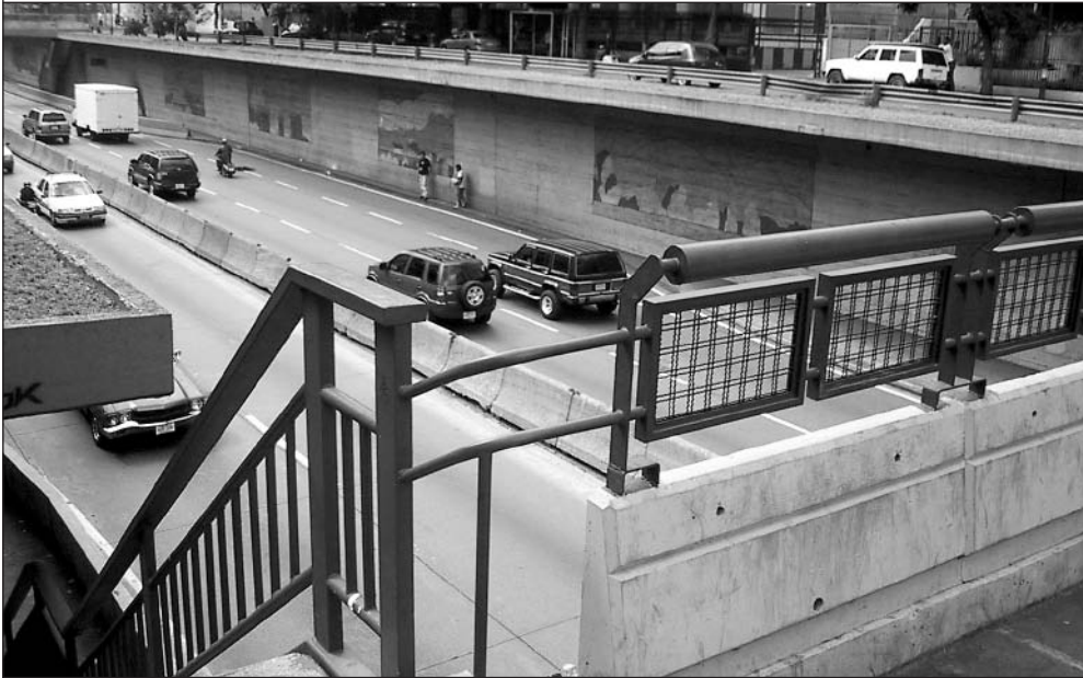
Imagen 2: Pasarela, avenida Libertador.