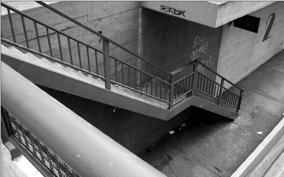
Imagen 3: Escaleras, avenida Libertador.