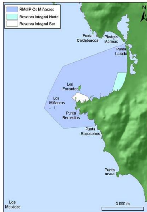
Figura 2 Zonificación de la RMIP de “Os Miñarzos”