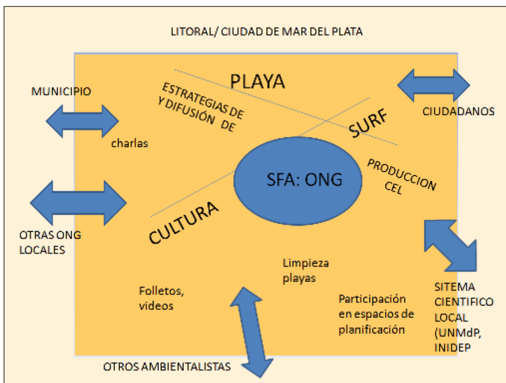
Figura 7 Sistema de producción de CEL de la SFA