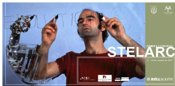
Imagen 8, Imagen 9. Stelarc en Lima. Afiche de su presentación en la Municipalidad de Miraflores en 2001.

Un ejemplo claro de su pensamiento es la performance titulada Evolution , donde utiliza una tercera mano robótica, construida a la misma escala que su mano derecha y acoplada al brazo del artista como un añadido al cuerpo. Los movimientos de esta tercera mano son controlados por el artista a través de impulsos eléctricos de los músculos abdominales y de la pierna izquierda, consiguiendo así un movimiento independiente de las tres manos (imagen 8, imagen 9). Con la disponibilidad de tres miembros independientes (una obvia ventaja al cuerpo orgánico) Stelarc escribe de manera simultánea la palabra Evolution , es decir, cada mano escribe las tres letras respectivas, para componer la palabra al mismo tiempo. Es una acción simple, pero potente, que nos invita a reflexionar sobre los alcances de una nueva naturaleza del cuerpo y las posibilidades que se abren al asimilar la idea.