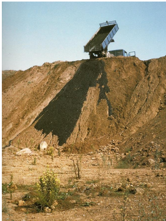
Imagen 5. Robert Smithson, Asphalt Rundown , Italia 1969. Acción /intervención en las afueras de Roma.

Así, esta entropía también es cultural, es un desgaste de sistemas económicos y sociales que, cada vez más, se integran y se interrelacionan, generando al final una homogeneización de la cultura humana (Smithson 1993). Llegará un momento en que conoceremos tanto el futuro y tan poco el pasado, que se confundirán y se invertirán; Smithson sostuvo que “el futuro no es sino lo obsoleto, pero en sentido inverso” (Raquejo 1993, 18). En ese escenario, el individuo debe asimilar lo consumado sobre el territorio a su mundo simbólico, desplazando la razón para que esta asimilación resulte espontánea y, a través del arte, sea sublimada, es decir, el hombre debe mirarse a sí mismo a través del arte, observar el escenario que ha creado y asimilar las consecuencias visibles y físicas a su cultura.