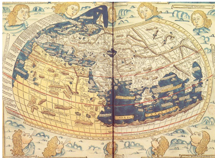
Imagen 1. Mapa Mundi reconstruido a partir de la Geografía de Ptolomeo. Johannes de Armsrhein, 1482.

El mapa refleja la relevancia de la imagen, producto de un proceso artístico que combina procedimientos científicos en un solo objeto fundamental para el desarrollo del “progreso”, pues permitieron rutas comerciales globales por mar y por tierra, estrategias bélicas, localización de recursos, delimitación de fronteras o la gestión de territorios. Para finales de siglo XIX, los procesos representacionales de la geodesia adoptarán, gracias a la tecnología, un perfil eminentemente tecnológico/científico, gracias a la inclusión de la fotografía aérea. Desde los inicios del siglo XX, la interrelación entre arte y ciencia se irá diluyendo, inclinándose su peso hacia la esfera científica.