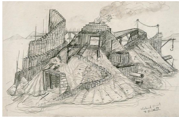
Imagen 6. Robert Smithson, Entropic landscape , dibujo, 1970.

Robert Smithson propone un retorno a la estupidez de la visión, señalando que todos los conceptos abstractos son ciegos y que el pensamiento de lo visible y espontáneo debe cuestionar el espacio del lenguaje y su relación con la memoria, generando un paisaje entrópico y adhiriéndolo a una realidad cotidiana 6 . Con dichas prácticas artísticas pretende vaciar de significado a estos elementos para después resignificarlos estéticamente desde una mirada sin prejuicios. Así, relega el uso del pensamiento abstracto en la contemplación y encuentra en esos elementos características estéticas que se asimilen espontáneamente como paisaje.