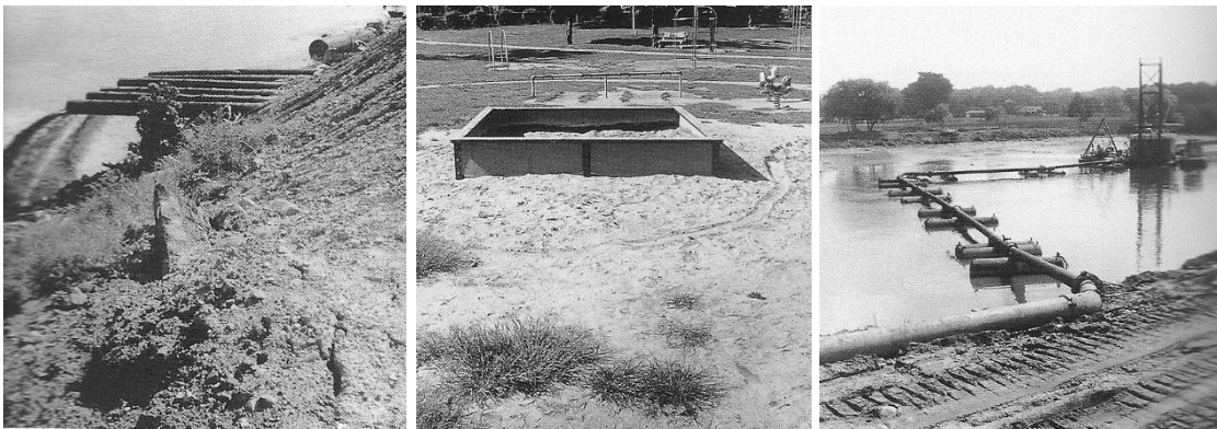
Imagen 2, Imagen 3, Imagen 4. Robert Smithson, Monuments of Passaic , 1967. Obra de registro de áreas industriales en las afueras de Nueva Jersey.