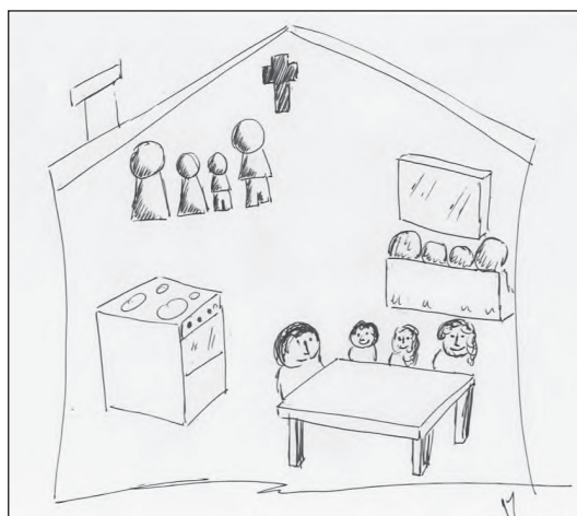
Figura 3. ¿Cómo ha cambiado el rol del padre o madre de familia en tiempos de confinamiento?

Fuente: Dibujo elaborado por Jaime Maldonado (Proyecto "Recreando los Lazos Sociales" 2020c).