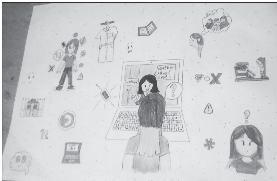
Figura 2. ¿Cómo ha cambiado el rol de estudiantes en tiempos de confinamiento?

Fuente: Dibujo elaborado por Rennylys Aular Franco (Proyecto "Recreando los Lazos Sociales" 2020b).