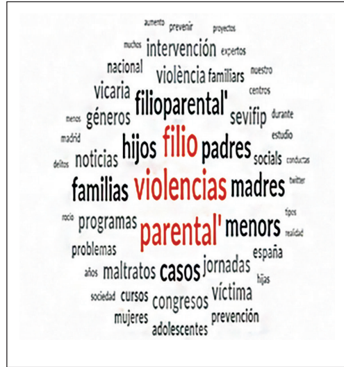
Figura 1. Nube de frecuencias

En la figura 1 se muestra la nube de frecuencias de los términos más utilizados en el corpus de mensajes. En ella destaca la frecuencia de términos comunes como hijo, filio, padres, violencias, pero también se observa una considerable frecuencia de términos asociados a la formación e intervención en la violencia filio-parental: congreso, programas, intervención. Por otro lado, es significativo la alta frecuencia de los términos vicaria, el decimoséptimo y Rocío el cuadragésimo quinto. Estos términos solo se utilizan desde el pasado año y están vinculados al discurso generado tras la emisión de los programas del grupo Mediaset. La tabla 4 muestra la clasificación de las temáticas principales del corpus de tuits analizado a partir de la identificación automática obtenida con NVIVO 12.